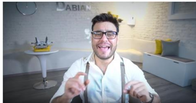
Este ejemplo tiene un fondo y set muy trabajados.

Funcionan muy bien: estanterías con libros o fondos neutros con algún detalle natural, por ejemplo una planta o tiesto.