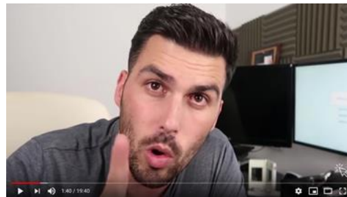
Un plano muy cerrado, agobia