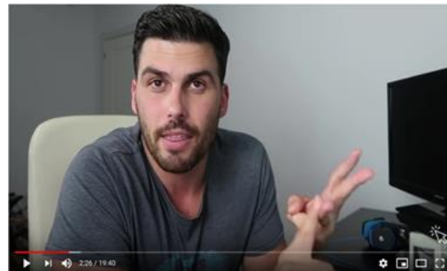
Mejor un plano medio