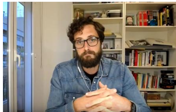
Webinar lanzado con cascos de Iphone