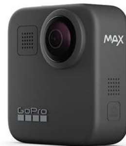
Cámara Go Pro