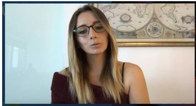
Este otro fondo también funciona.